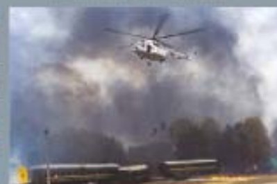
Войсковой вертолёт в подразделениях МЧС России