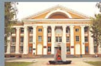
Учебный институт противопожарной и технической помощи МЧС России (Санкт-Петербург)