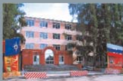
Первый в мире «домашний» учебник МЧС России