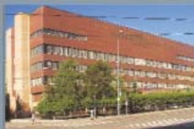
Лауреат Государственной премии в области МЧС России