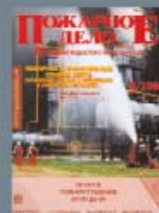
Журнал «Пожарное дело» основан в 1984 г.