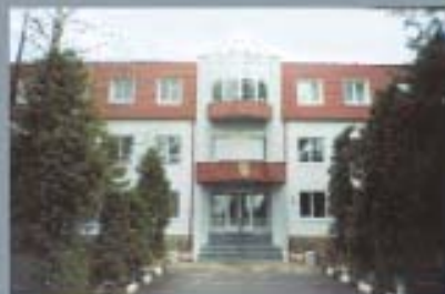
Лауреат премии в области МЧС России