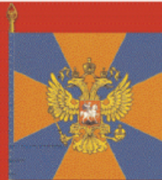
Знамя войск гражданской обороны Указом Президента Российской Федерации от 17.05.2001 №347