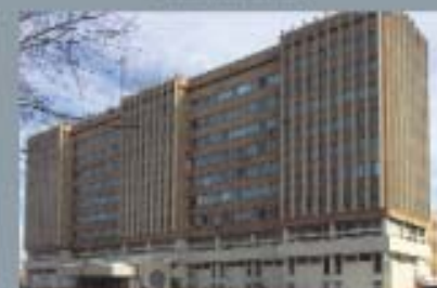
МЧС образовательный центр по подготовке специалистов в области гражданской обороны и противопожарной службы МЧС России

● постоянно помнить, что пользу простому человеку и обществу может принести сотрудник системы МЧС России, постоянно совершенствующий свою квалификацию, профессиональную подготовку, стремящийся быть всесторонне развитым, высокообразованным, использующий в своей деятельности прогрессивные методы, технологии и передовой опыт