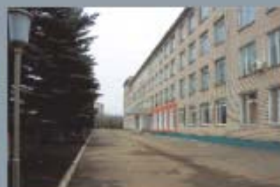
Важнейший центр Государственной противопожарной службы МЧС России