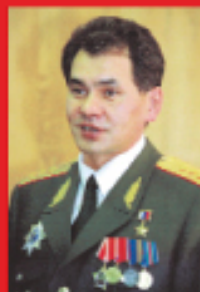
Генерал-полковник Шойгу Сергей Кузнецович , министр Российской Федерации по делам гражданской обороны, чрезвычайным ситуациям и ликвидации последствий стихийных бедствий