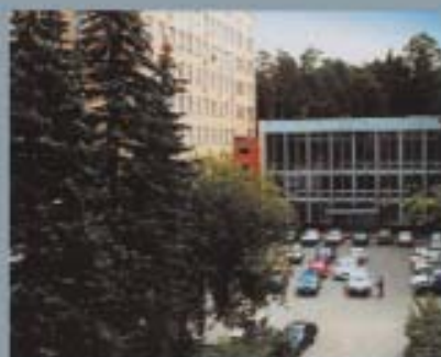
ФГП - Всероссийский научно-исследовательский институт противопожарной службы МЧС России

30-й Лауреат премии сотрудников МЧС России