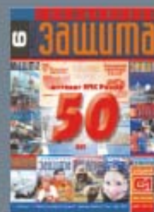
Журнал «Гражданская защита» основан в 1984 г.