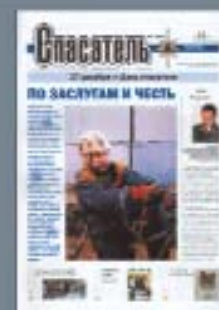
Газета «Спасатель» основана в 2001 г.