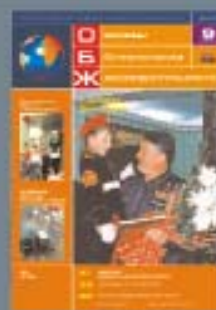
Журнал «Опасная безопасность» основан в 1988 г.