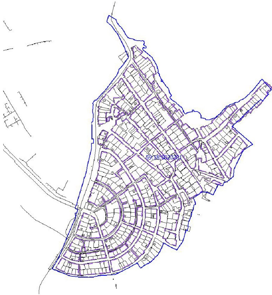
Рис.4 Местоположение утверждаемых красных линий

2. В отношении земельных участков, местоположение границ которых не установлено в соответствии с требованиями земельного законодательства, в том числе в случае, если местоположение границ характерных точек границ земельных участков определено с точностью ниже нормативной (для земельных участков, отнесенных к землям населенных пунктов эта величина составляет – 0,1 м), установить местоположение границ таких земельных участков исходя из сведений, содержащихся в документах, подтверждающих право на земельные участки, документах,