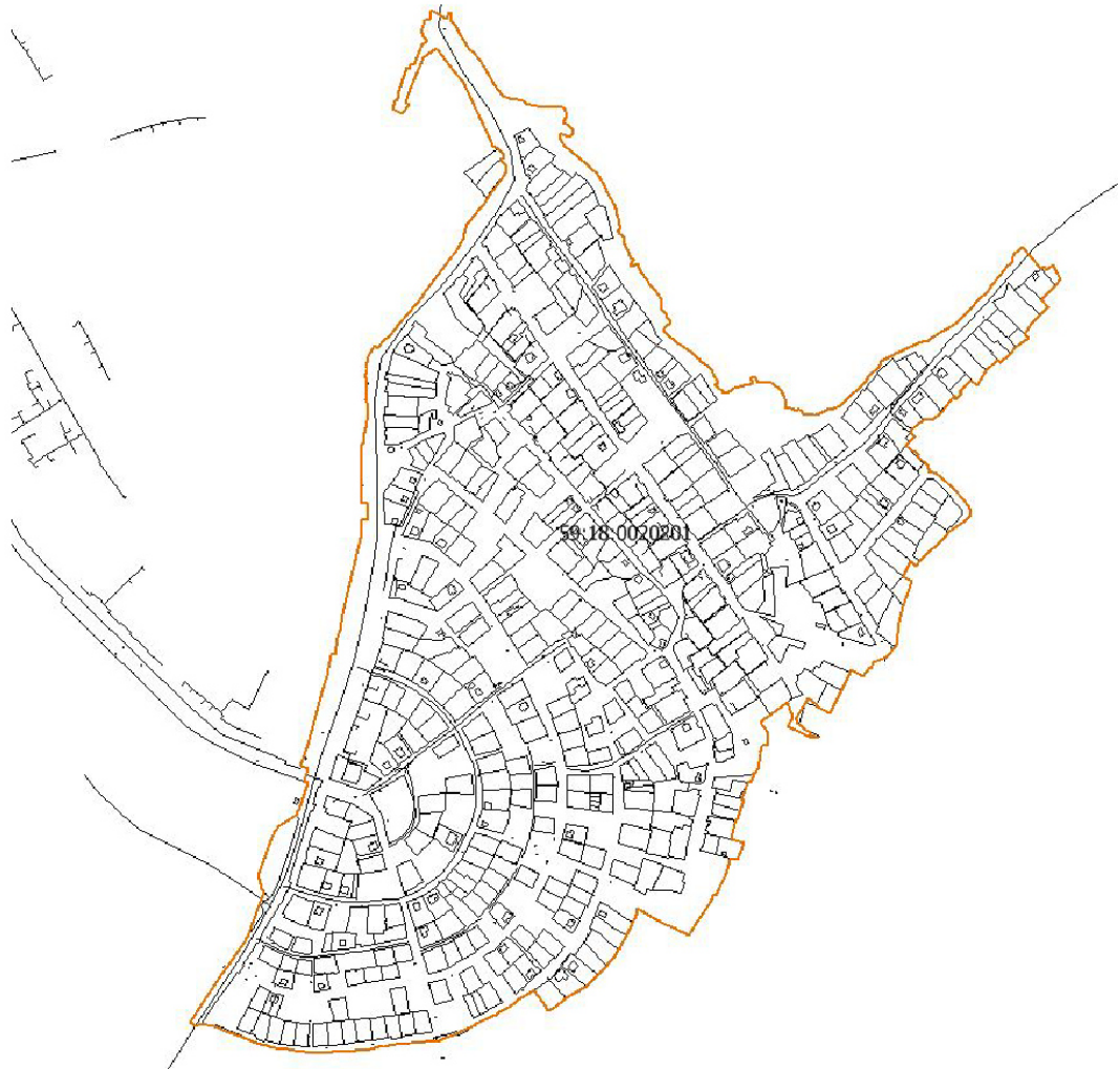
Рис. 2 Местоположение территории проектирования

Площадь территории в утвержденных границах проектирования составляет 909160, 6 кв.м. (90,92 га).