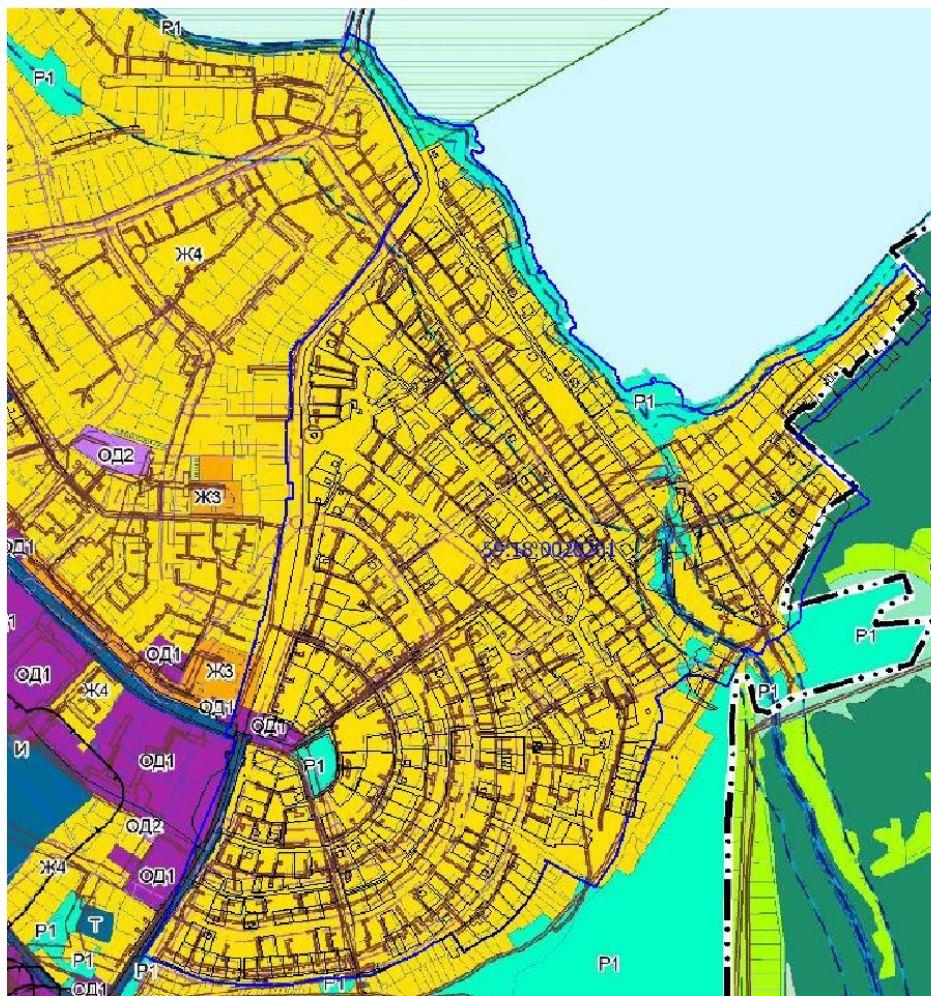
Рис.3 Фрагмент карты градостроительного зонирования р.п. Полазна

В соответствии с Правилами землепользования и застройки Добрянского городского округа, утвержденных Постановлением Администрации Добрянского городского округа Пермского края, рассматриваемая территория расположена в границах территориальных зон: Ж4 (Зона застройки индивидуальными жилыми домами), ОД1 (Многофункциональная общественно-деловая зона) и Р1 (Зона озелененных территорий общего пользования).