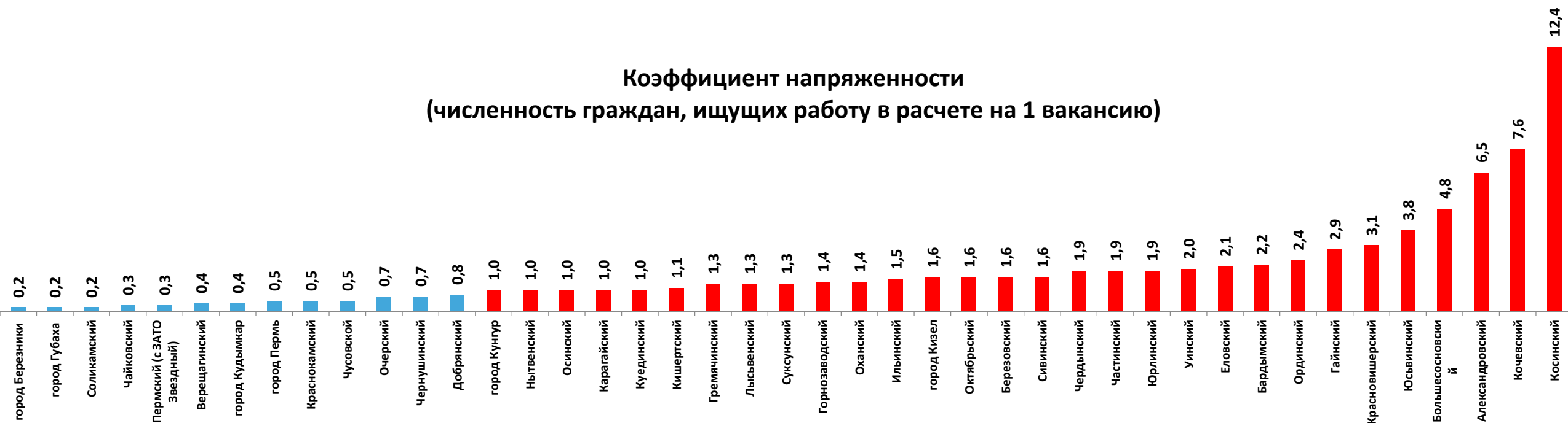
Коэффициент напряженности (численность граждан, ищущих работу в расчете на 1 вакансию)

13 МО (до 1) – дефицит кадров, 30 МО (свыше 1) – дефицит рабочих мест